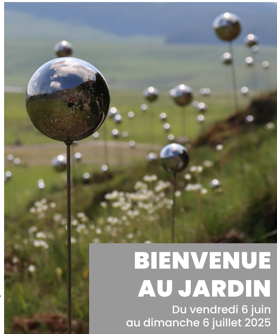
Installation « Qi Flowers » © Christian Delecluse