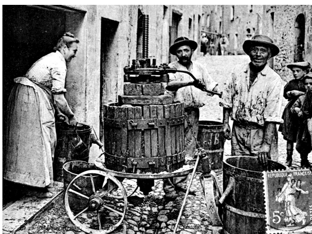
AD83 - 2 FI 146

Le musée est abrité dans l'ancien Palais des Comtes de Provence. Tout d'abord conçu comme une bâtisse défensive, le Palais est aménagé à partir du milieu du 13 e siècle pour devenir une résidence comtale. Dès lors, c'est ici que les Comtes de Provence séjournent lorsqu'ils sont de passage à Brignoles. Au-delà de sa fonction de résidence comtale, le bâtiment a aussi abrité le Palais de Justice, la Cour des Comptes, le Parlement de Provence, une école, la Préfecture et la Sous-Préfecture, un dispensaire... et même un grenier à blé ! Le musée, qui bénéficie de l'appellation « Musée de France », est ce qu'on appelle un musée mixte. On y trouve des thématiques très diversifiées, alliant archéologie, art sacré, beaux-arts, arts et traditions populaires, mais aussi histoire naturelle.